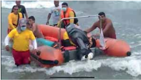
Dos jóvenes murieron el jueves en San Marcos de Colón. El Cuerpo de Bomberos realizó el rescate de los cadáveres.

De igual forma, detalló acerca del rescate de unas 20 personas en diferentes playas del país, específicamen-