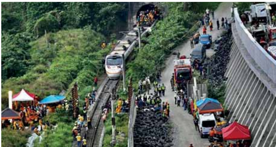
Honduras también se solidarizó con el pueblo y gobierno de Taiwán.

La Cancillería hondureña manifestó que "Honduras, también trasladó su sentido de pesar a los familiares y amigos de las víctimas mortales y desea la pronta recuperación de los heridos". El accidente fue provocado por el choque entre el tren de alta velocidad que llevaba cerca de 500 pasajeros y un camión que había invadido la vía ferroviaria.