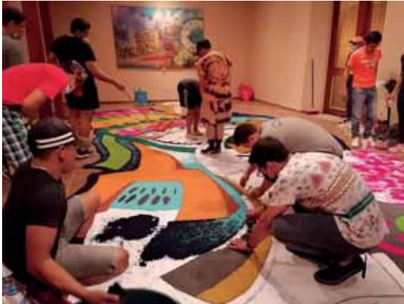
Las alfombras de Comayagua son uno de los atractivos más apetecidos para los turistas.

Las celebraciones se limitan únicamente a mantener la tradición, sobre todo la religiosa, el fervor cristiano y la tradición cultural que Semana Santa promueve en la ciudad colonial.