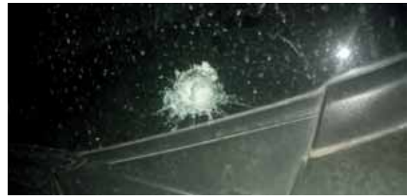
La unidad presentaba seis perforaciones de bala en su parte frontal, techo y en la puerta lateral izquierda.