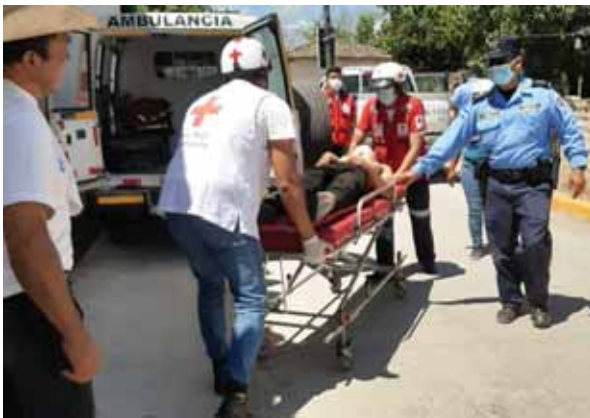
Paramédicos realizaron el transbordo en la periferia de Tegucigalpa para luego proceder con el traslado hacia el Hospital Escuela.