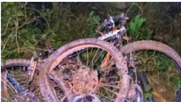
Así quedaron las bicicletas de los infortunados copanecos en un sector solitario de La Jigua.

Las víctimas originarias de la comunidad de Chepelares, aparentemente regresaban a sus casas tras partir en La Jigua cuando sufrieron el fatal percance.