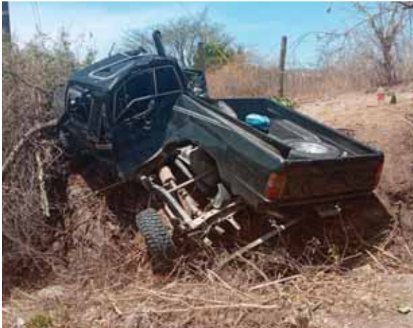
Por milagro de Dios no se registraron personas fallecidas en este nuevo accidente vial en la zona oriente de Honduras.

Los heridos fueron llevados en carros particulares a centros asistenciales y en un punto cercano a Tegucigalpa fueron atendidos por paramédicos en transbordo a las ambulancias de la Cruz Roja.