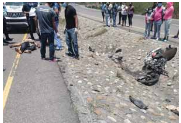
La mujer no identificada expiró a causa de golpes en su cabeza.

Una mujer murió a causa de golpes que recibió cuando la motocicleta en que se transportaba fue impactada por un carro en el sector de Punta Gorda, en el desvío a Lamani, Comayagua, a la altura del Canal Seco, en la zona central de Honduras.