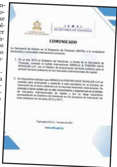
El gobierno aclaró que la firma también asesoró este proceso en el 2013 y 2017.

Justifican que "se contrató a dicho bufete por su alto conocimiento y experiencia en el ámbito de mercados internacionales de capital y por su