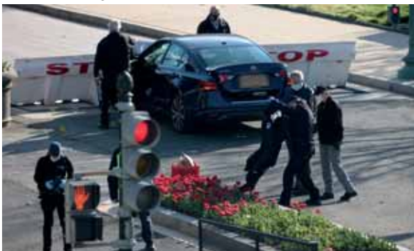
Un policía murió después de que una persona lo atropellara delante del Capitolio de Estados Unidos, antes de salir del coche cuchillo en mano y ser abatido.