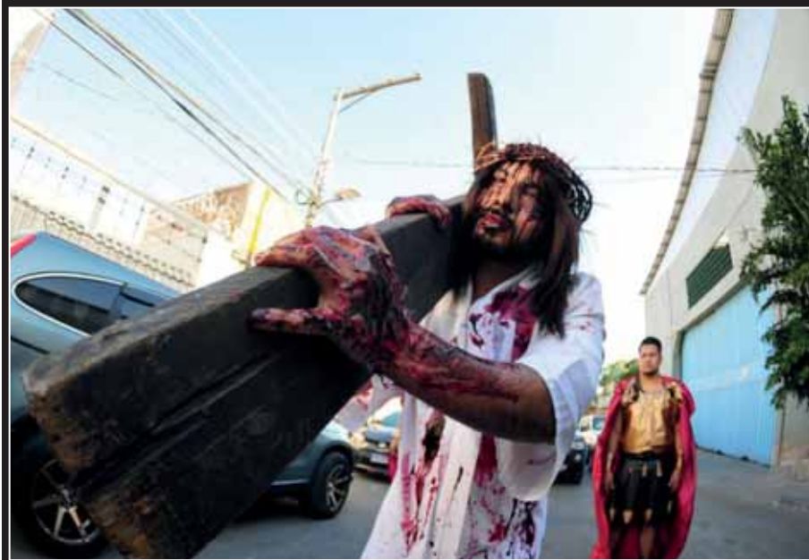
Un vía crucis móvil conmovió ayer a la feligresía católica, que recordó la pasión de Cristo, con fe y devoción.