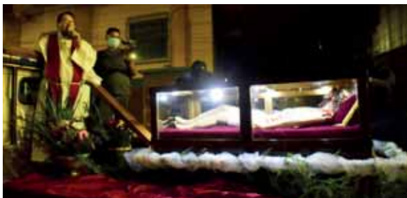
Debido a la pandemia, el Santo Entierro se hizo con un recorrido en vehículo, por el centro histórico de la capital.