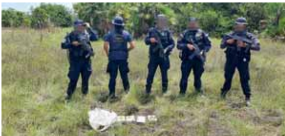
La Policía fortaleció las operaciones en La Mosquitia hondureña en la búsqueda de sustancias ilícitas.

Las evidencias fueron remitidas al Laboratorio de Toxicología Foren-