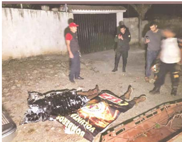
El rescate resultó conmovedor en esa nueva tragedia de hondureños que buscan el "sueño americano".