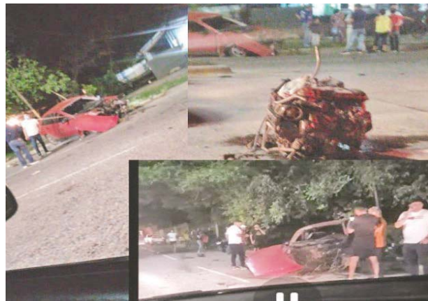
Así quedó uno de los vehículos a causa del fuerte impacto.