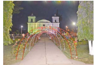
Danlí y su catedral en Navidad del 2017.