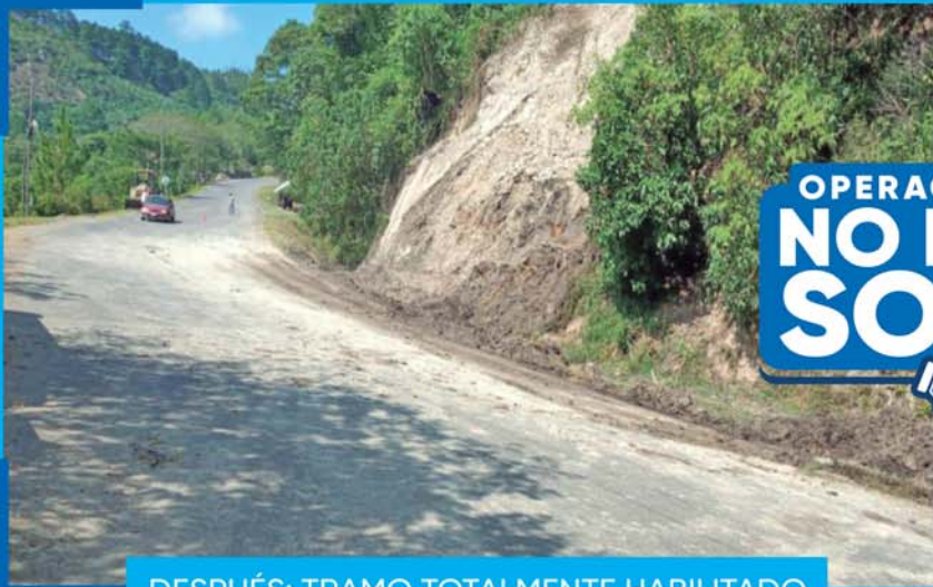
DESPUÉS: TRAMO TOTALMENTE HABILITADO