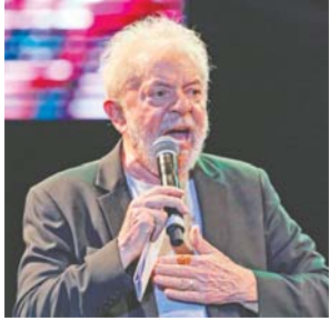
Luiz Inácio Lula da Silva.