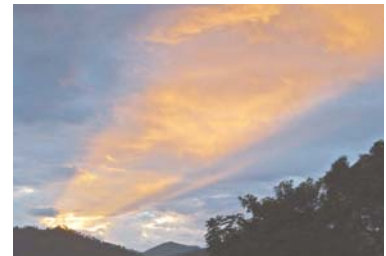
Y el resplandor del Señor apareció a los pastores, anunciando el nacimiento del Mesías.

Vinieron pues, apresuradamente, y hallaron a María y José, y al niño acostado en el pesebre.