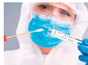
Las pruebas de antígeno se aplican a las personas sintomáticas y el resultado se obtiene en 25 minutos.

Bock indicó que sostuvo reuniones con los seis directores de los centros de triaje instalados en Tegucigalpa y Comayagüela, con quienes se trataron diferentes temas, entre ellos la aplicación de los test que por lo general se trata de pruebas de hisopo. Agregó que los microbiólogos serán capacitados el lunes para que el martes empiece a practicar las pruebas, ya que el propósito es detectar más pacientes positivos en los diferentes triajes que presentan un 12