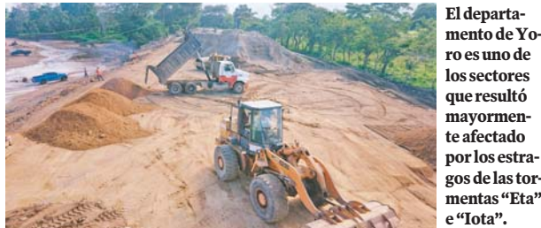
El departamento de Yoro es uno de los sectores que resultó mayormente afectado por los estragos de las tormentas "Eta" e "Iota".

Las autoridades de la Secretaría de Infraestructura y Servicios Públicos (Insep), realizan labores de supervisión técnica en la rehabilitación del sistema vial afectado severamente por el impacto de las tormentas tropicales "Eta" e "Iota", en el departamento de Yoro.