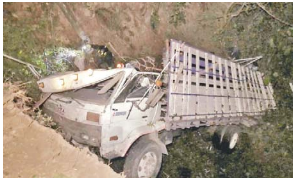
La máquina se dirigía hacia un beneficio de café, pero al llegar al kilómetro 78 de la ruta, el piloto perdió el control y cayó en un abismo de unos 30 metros.

Fiscales del Ministerio Público de Guatemala realizaron las investigaciones correspondientes para determinar qué fue lo que originó ese accidente. Posteriormente ordenaron que los cuerpos fueran trasladados hacia la morgue correspondiente donde será reclamados por autoridades hondureñas.