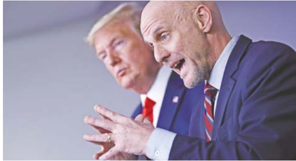
El director de la Administración de Alimentos y Medicamentos (FDA, por sus siglas en inglés), Stephen Hahn, dijo que las noticias de que la Casa Blanca lo amenazó con su despido son "imprecisas".