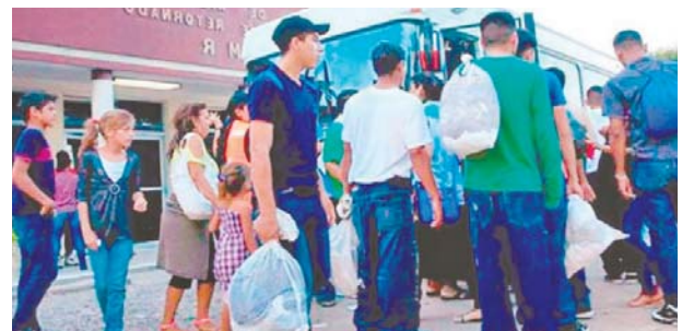
Pese a la pandemia del coronavirus han sido deportados este año cerca de 35,000 “catrachos”.

hondureños, de ellos 1,524 niños y adolescentes, algunos no acompañados. Desde México fueron retornados al país por la vía aérea 13,757 migrantes indocumentados, incluyendo 1,594 menores. También 8,072 hondureños fueron retornados por las autoridades mexicanas vía terrestre, mientras que a 633 nacionales los repatriaron desde países centroamericanos.