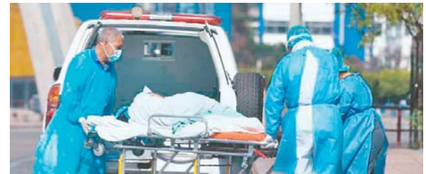
Entre la noche del viernes y la mañana del sábado se reportó la muerte de cuatro personas bajo la sospecha de coronavirus.

Hasta el momento en el máximo centro asistencial del país no se ha ingresado a pacientes a la Unidad de Cuidados Intensivos (UCI) por el padecimiento del coronavirus. Por su parte, la portavoz del IHSS, Cecilia Mendoza, confirmó el fallecimiento de una persona más en el Hospital de Especialidades, donde se encuentran 52 pacientes hospitalizados, cinco de ellos en la UCI.