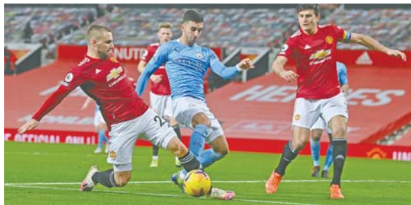
Un insípido empate sin goles tuvieron los dos equipos de Manchester, United y City.

dan provisionalmente 7º y 8º con 20 y 19 puntos respectivamente, mientras que Tottenham y Liverpool lideran la tabla con 24 unidades.