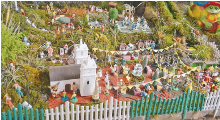
Los tradicionales nacimientos, muestran la esencia y costumbres de los pueblos.

señal: He aquí que la virgen concebirá, y dará a luz un hijo, y llamará su nombre Emanuel, acto seguido, volvemos a la magia de la Navidad.