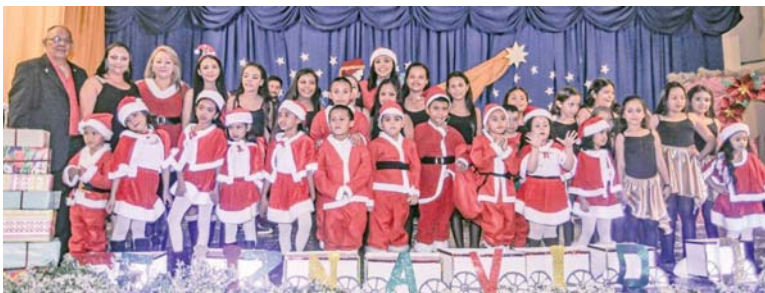
Un hermoso recuerdo de la Navidad del 2019 en la Casa de la Cultura.

Aquella fue la mejor de las navidades, con todo su realismo. Sin embargo, no perdamos la magia de la Navidad. Dios con nosotros entre la pandemia que ha cobrado miles de vidas y la tragedia de las tormentas tropicales con miles de damnificados que no tendrán una Navidad feliz en el seno de sus hogares. Hoy es el momento de la solidaridad para llevar un poco de alivio a los que sufren. Deja a Cristo entrar y no le dejes en el pesebre de la indiferencia.