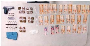
La DPI remitió ante la Fiscalía al "Traka" con todo y evidencias.

A el "Traka" le decomisaron una pistola calibre 380 con su respectivo carga-