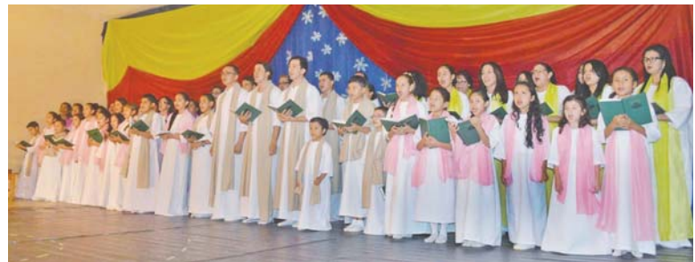
Concierto de Navidad en la Casa de la Cultura.