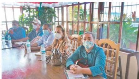
Desde varios puntos del país llegaron transportistas que le dieron un plazo de 72 horas al gobierno para darle respuesta a lo convenido.

SIGUATEPEQUE, Comayagua. Alegando incumplimiento de las autoridades del Instituto Hondureño del Transporte Terrestre (IHTT) al gremio del servicio interurbano y urbano, convenido en un compromiso por escrito hace tres meses, la dirigencia de ese sector da 72 horas a partir de la fecha para que puedan presentar respuestas concretas a los puntos acordados, caso contrario ejecutarían una paralización indefinida del transporte a nivel nacional. Lo anterior fue anunciado en una asamblea informativa convocada de emergencia en la "ciudad de los pinares", donde participaron representantes de ese gremio que llegaron desde Valle, Choluteca, zona suroccidente, centro del país, Tegucigalpa, quienes exigen la inmediata respuesta de los titulares del IHTT.