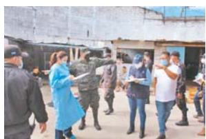
Las autoridades del INP han habilitado espacios y mecanismos de bioseguridad para salvaguardar la salud de los internos y sus familiares.

uno de los módulos del establecimiento, aprovechando la oportunidad para socializar los lineamientos para habilitar la visita cumpliendo con las medidas de bioseguridad dictaminadas por el Sistema Nacional de Gestión de Riesgos (Sinager).