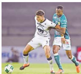
En el juego de ida, León y Pumas igualaron 1-1.

de la final, en el estadio Olímpico Universitario, los Pumas se pusieron en ventaja con gol del paraguayo Carlos González, pero León rescató el empate 1-1 con anotación del argentino Emanuel Gigliotti a escasos minutos del final. MARTOX