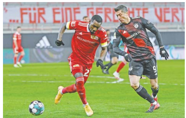
El Bayern se vio sorprendido por el Unión Berlín.