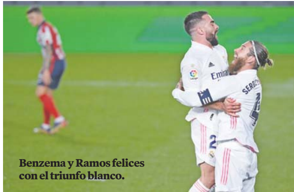
Benzema y Ramos felices con el triunfo blanco.

Con esta victoria, el Real Madrid, que el pasado miércoles logró una sufrida clasificación para los octavos de final de la Liga de Campeones, remonta al tercer puesto provisional de la clasificación del campeonato español con 23 puntos, dos por detrás de la Real Sociedad, que el domingo recibirá al Éibar (13º) y dos por delante del Villarreal (4º), que podría superar a los blancos si gana