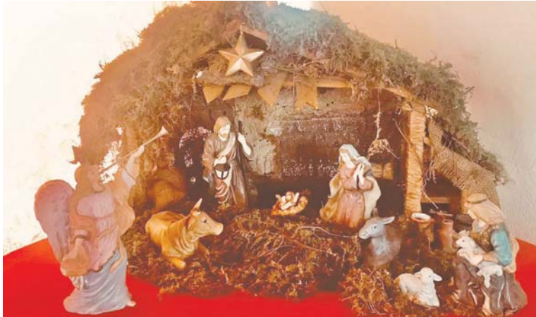
Aquí está el misterio y la magia de la Navidad.

Luego el profeta, 700 años antes que ocurriera el nacimiento del Mesías, lo anuncia diciendo: alguien en la familia de David, que nacerá de una virgen; evidentemente el renuevo, mencionado por el mismo profeta en el capítulo 4:2. En aquel tiempo el renuevo de Jehová será para hermosa y gloria, el fruto de la tierra para grandeza y honra a los sobrevivientes de Israel. "Por tanto, el Señor mismo os dará