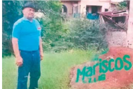
Para hacer realidad su sueño de poner su negocio, el emprendedor invirtió en material de construcción y uso de maquinaria.

Hace más de 20 años, un entusiasta pescador sureño partió desde la ciudad-puerto de Amapala, en la Isla del Tigre, Golfo de Fonseca, en el departamento de Valle, rumbo a la capital hondureña con la ilusión de abrir un restaurante de mariscos.