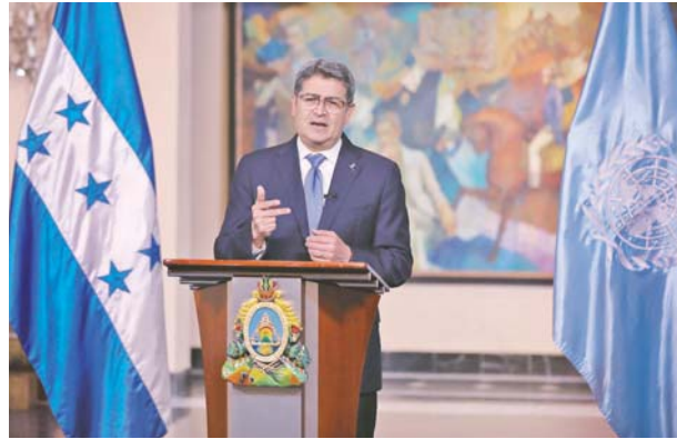
Presidente Juan Orlando Hernández: “En sus manos está hacer justicia con un país digno, que hoy está de rodillas y que necesita la mano solidaria del mundo para levantarse”.

Lo que ha pasado en nuestro país tiene dimensiones apocalípticas. La destrucción de varias zonas del país es total. El retroceso que nos genera como nación en vías de desarrollo estos acontecimientos es quizá de 50 o 100 años; no lo sabemos aún, porque el desastre es de tal magnitud que no