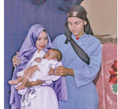
Una representación en vivo de José, María y el niño.

Para el mundo de aquel entonces este acontecimiento pasó inadvertido, no así para los pastores, una vez que los ángeles se habían ido dijeron unos a otros: Pasemos, pues hasta Belén y veamos esto que ha sucedido, y que el Señor nos ha revelado.