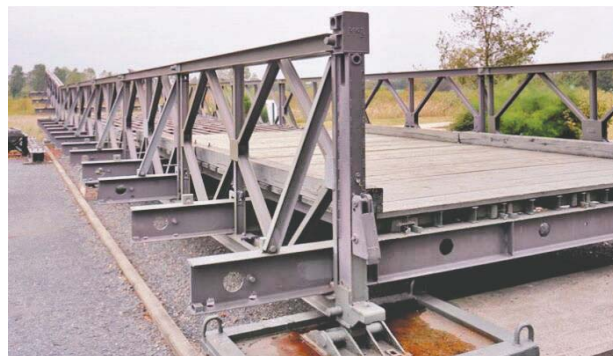
Por recomendaciones expresas de la Oncae, al final solo quedaron seis empresas que son las que podrán presentar sus ofertas de puentes Bailey.

Tras la inspección en el centro penal representantes de derechos humanos y las autoridades del INP junto a la Secretaría de Salud, intercambiaron opiniones en relación al tema de la visita para delegar si se permite o no el ingreso de parientes de los reclusos.