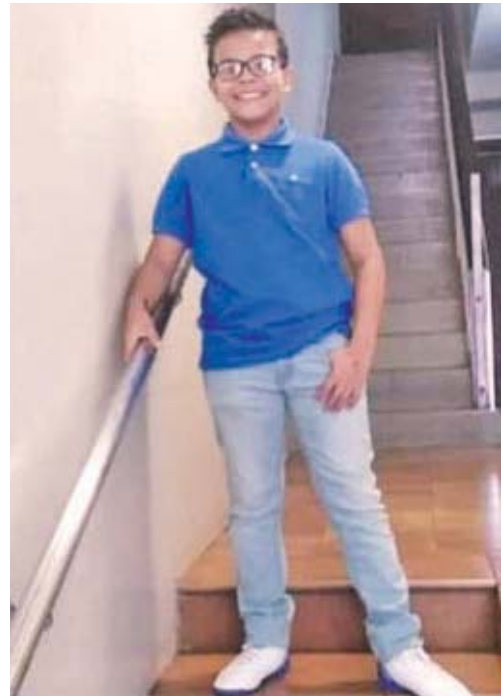
El caso toma otro giro con la muerte de una de las piezas claves en la desaparición de Enoc Pérez.