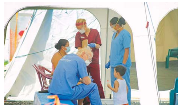
El 12 de noviembre, el personal médico de “Samaritan’s Purse” aceptó a los primeros pacientes en el “Emergency Field Hospital”, una clínica ambulatoria después del huracán “Eta”.

duras con un equipo de 20 a 25 médicos provenientes de Estados Unidos y Canadá, los cuales se dividen en médicos generales, especialistas en emergencia, enfermeras pediátricas y otras especialidades, personal auxiliar y técnicos encargados de las diferentes áreas y farmacia”.