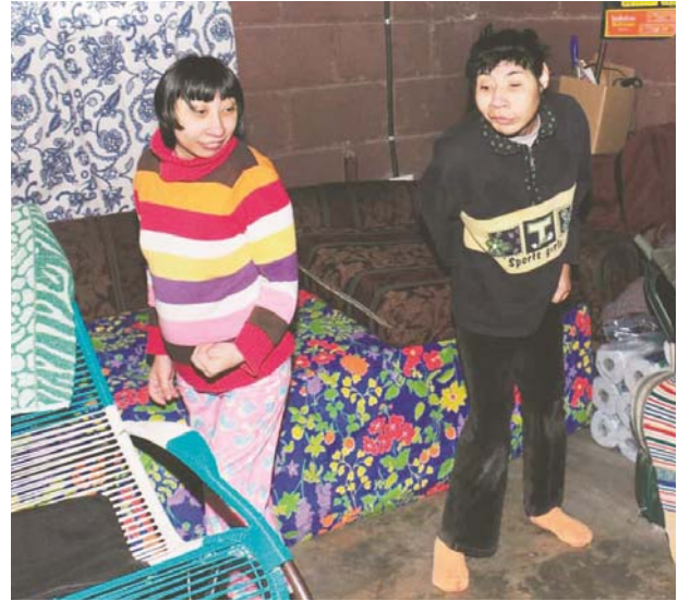
Las hermanitas necesitan la ayuda de los hondureños de buen corazón que puedan colaborar ya sea con pañales, leche o apoyo en efectivo.

sus medicinas o entra en crisis o “shock” nerviosos, y solo para esos tres medicamentos yo debo tener cinco mil lempiras, y ahora por su anemia le doy solo leche deslactosada”, dijo la madre en-