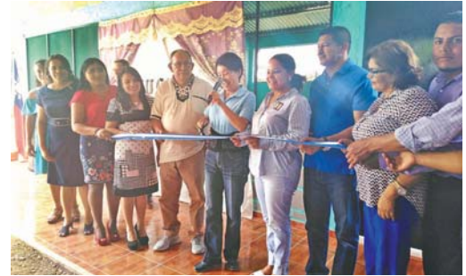
En la educación. Inauguración de un aula en Villa Santa.