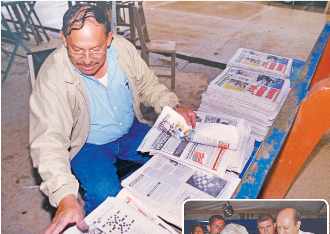
LA TRIBUNA siempre primero en la zona oriental.