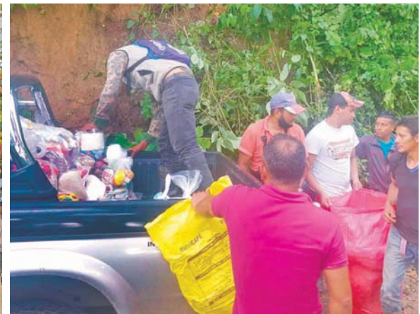
En la tragedia de las tormentas tropicales, apoyando la distribución de ayuda humanitaria.