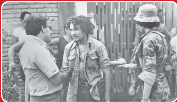
Reportajes de guerra en Nicaragua.