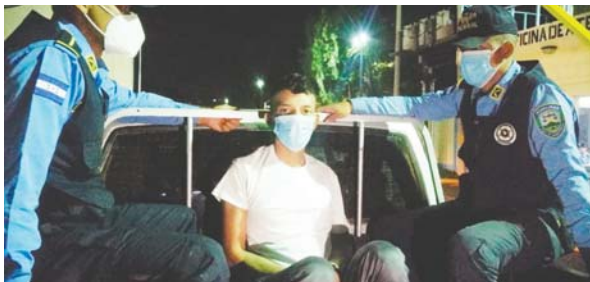
La DPI puso al imputado a disposición del Juzgado de Letras con Competencia Territorial Nacional en Materia Penal para que se continúe con el proceso legal en su contra.

Los hechos violentos se remontan al pasado 2 de diciembre del 2019, cuando se reportó un acto criminal en el barrio Campo Elvir de Tela, en