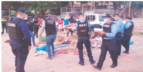
El primer decomiso de productos elaborados en base a pólvora asciende a unos 100 mil lempiras en efectivo.

El decomiso se realizó ayer mediante un allanamiento ejecutado en la colonia Divanna de Comayagüela y se trata de varios artefactos explosivos. En el allanamiento se detuvo a una mujer de 33 años de edad, para que responda por el producto decomisado. Según el parte policial, el decomiso incluye 32 morteros grandes y 127 medianos, cinco cajas de cohetes, 70 unidades de pañuelos, 22 cajas de volcancas, 12 cajas de silbadores, cinco paquetes de varilla de luz mediana, 93 unidades de pañuelos,