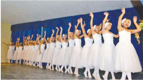
LA TRIBUNA en la cultura.