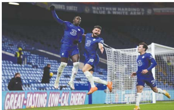
Chelsea amanece como líder de la Premier.

con 22 puntos, uno más que Tottenham y Liverpool, que se enfrentan hoy, tres