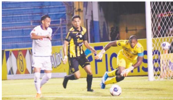
Olimpia y Real España cierran la sexta jornada.

Real España llega desesperado para buscar doblegar al Olimpia, ya que un empate los compromete y lo pone a depender del partido entre Platense y Vida, mientras que una derrota podría ser lapidaria en un juego tan clave y necesario para