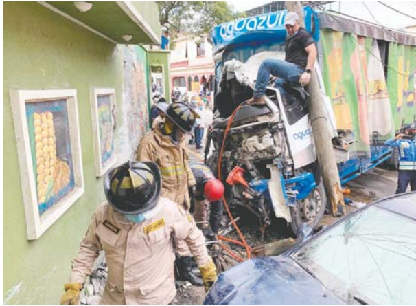
Los trabajadores quedaron atrapados, minutos después del choque fueron rescatados por elementos del Cuerpo de Bomberos.

No obstante, rápidamente al sector se hicieron presentes socorristas,