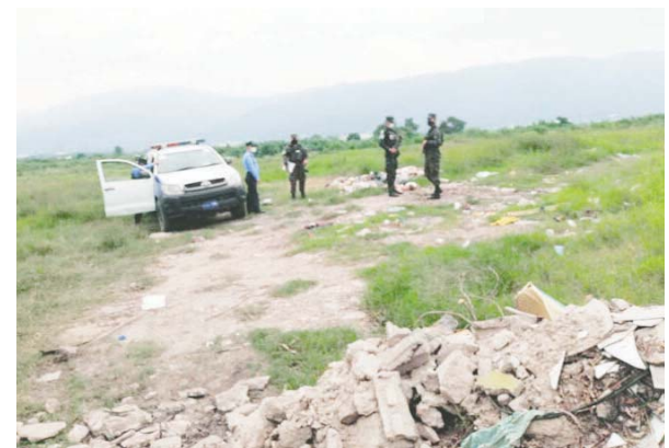
Preliminarmente se estableció que la víctima fue raptada, torturada y asesinada en otro punto de la ciudad.

Posteriormente al sector se desplazó una patrulla, cuyos agentes confirmaron que un cuerpo estaba en el interior de una bolsa plástica negra. Los efectivos se limitaron a resguardar la escena y hasta ayer por la tarde se desconocía la identidad y el sexo de la víctima, quien presentaba signos de tortura. (JGZ)