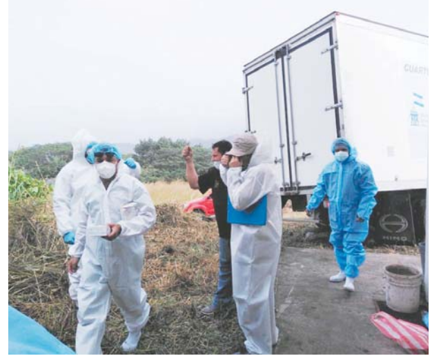
Equipos de patología depositaron los cuerpos sin nadie alrededor que derramara una lágrima.

del orden público por lo que la mujer será remitida a los Juzgados de Letras de lo Penal de Tegucigalpa. Desde hace varios años se emitió una ordenanza para controlar la venta y distribución de estos artefactos explosivos, en Tegucigalpa y Comayagüela. (JGZ)