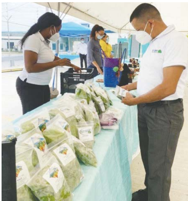
En Roatán promueven la economía interna en respuesta a la caída de ingresos por turismo debido a la pandemia.

“Nuestra campaña resaltarán las bondades, calidad y potencialidades de productos y servicios de nuestros micro y peque-