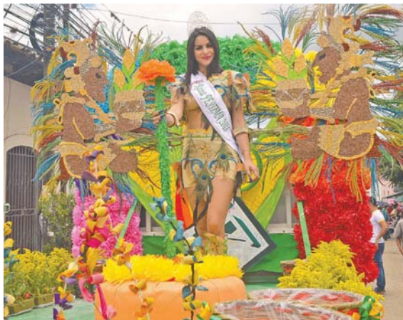
En los festivales del maíz.

Le hemos dado importancia relevante a la cultura en sus diferentes manifestaciones como parte fundamental de la proyección de un medio de comunicación comprometido con la