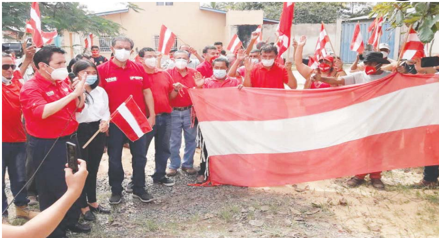
En Talanga hacen la respectiva juramentación.

Integrantes de la comisión de campaña del Movimiento Liberal Yanista y candidato a diputados liberales, por Francisco Morazán, juramentaron a los candidatos a la alcaldía de la ciudad de Talanga.