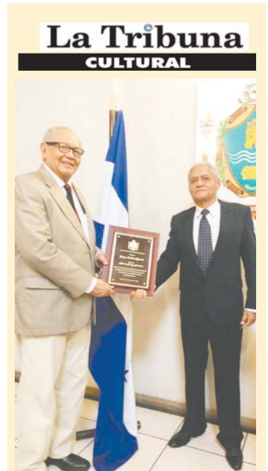
Academia Hondureña de la Lengua entrega "Premio Ramón Amaya Amador, 2020"