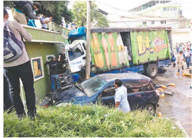
Afortunadamente en el estrepitoso accidente vial no hubo víctimas que lamentar.

Saavedra (23), quien presentaba herida contusa en su miembro superior derecho con sangrado activo, trauma en pelvis y en miembros superiores.