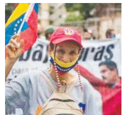
LT P. 9

CHAVISMO ELIGE UN NUEVO PARLAMENTO Y DEJA A GUAIDO CONTRA LAS CUERDAS