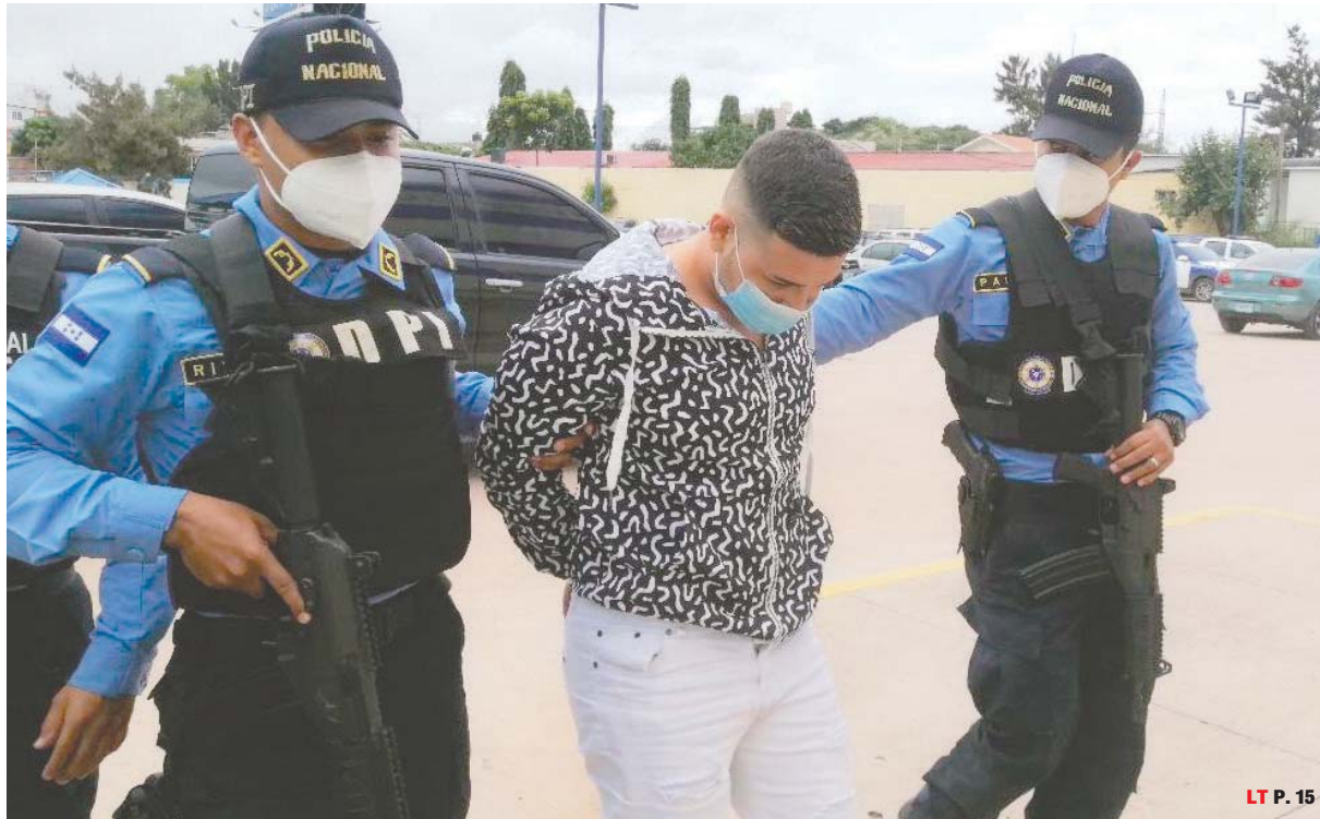
LT P. 15