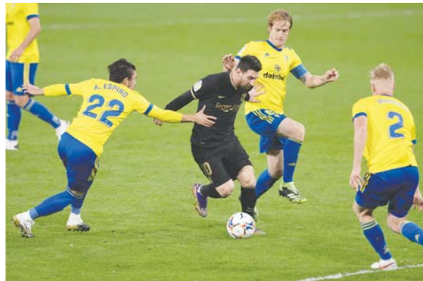
Barcelona cayó frente al Cádiz.

más que el Manchester United y cuatro más que el City. MARTOX