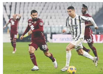
La "Juve" se llevó el derbi turinés.

La Juventus, que no ha perdido el derbi de Turín en su estadio desde hace 25 años, se sitúa tercera, a tres puntos del líder Milan, que juega su partido hoy en la cancha