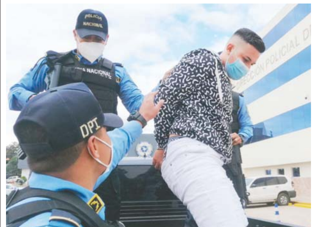
El ahora requerido se le presentará requerimiento fiscal, en vista de haber facilitado medios económicos, transporte, al actor material de haber cometido el homicidio.